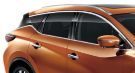
Оранжевый — EAW