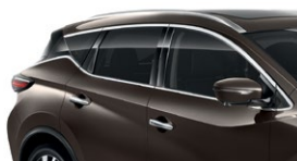
Серо-коричневый — CAM