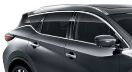
Темно-серый — KAD