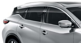
Серебристый — K23