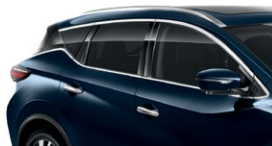
Темно-синий — RBG