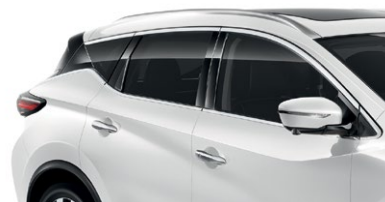
Белый перламутр — QAB