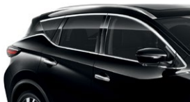
Черный — G41